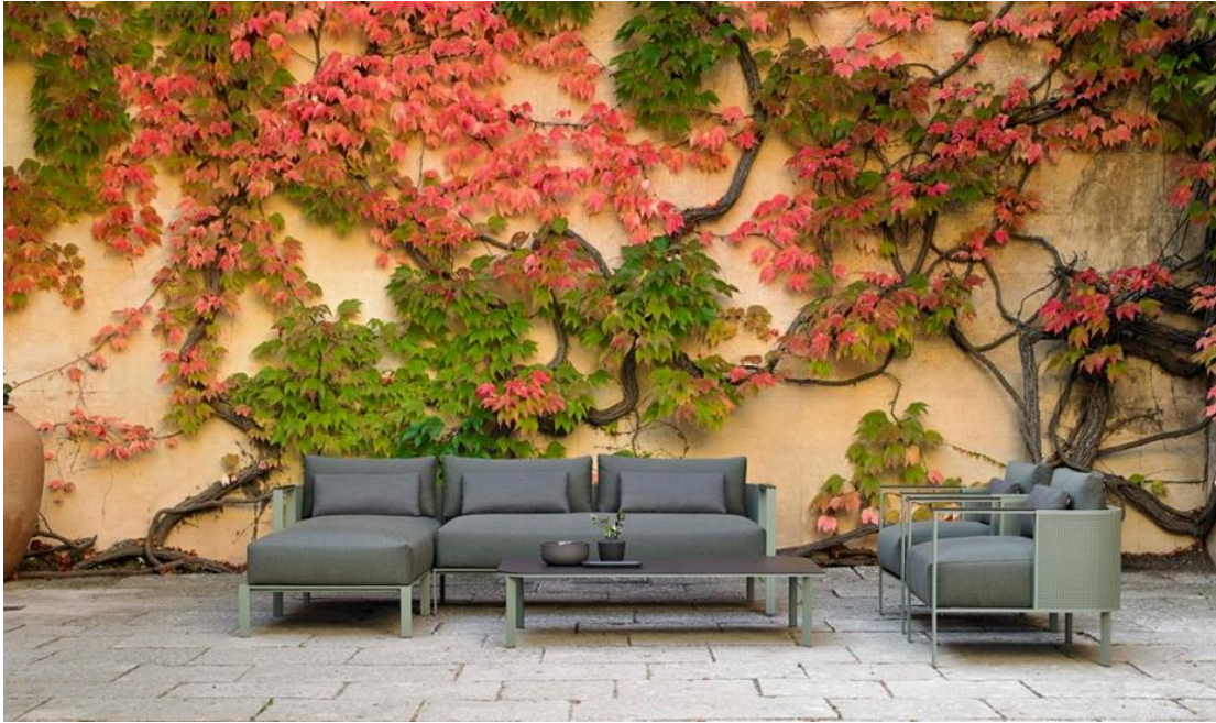
SOLANAS Modulsofa. GANDIABLASCO

Diesem innovativem Ansatz schließt sich gleichzeitig die Ehrlichkeit der zeitlosen Gestaltung von TIMELESS , ein Design von José A. Gandía-Blasco Canales und Borja García, an, das in die rationale Architektur des 20. Jahrhunderts eintaucht, um zugleich diskrete und eindrucksvolle Formen zu schaffen.