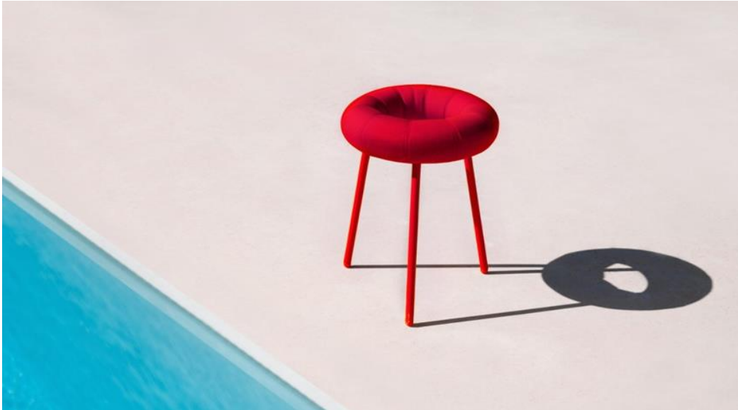
DONUT Sitz. DIABLA