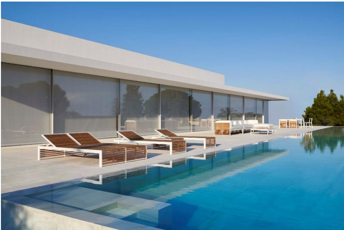
DNA- TEAK Linie. GANDIABLASCO