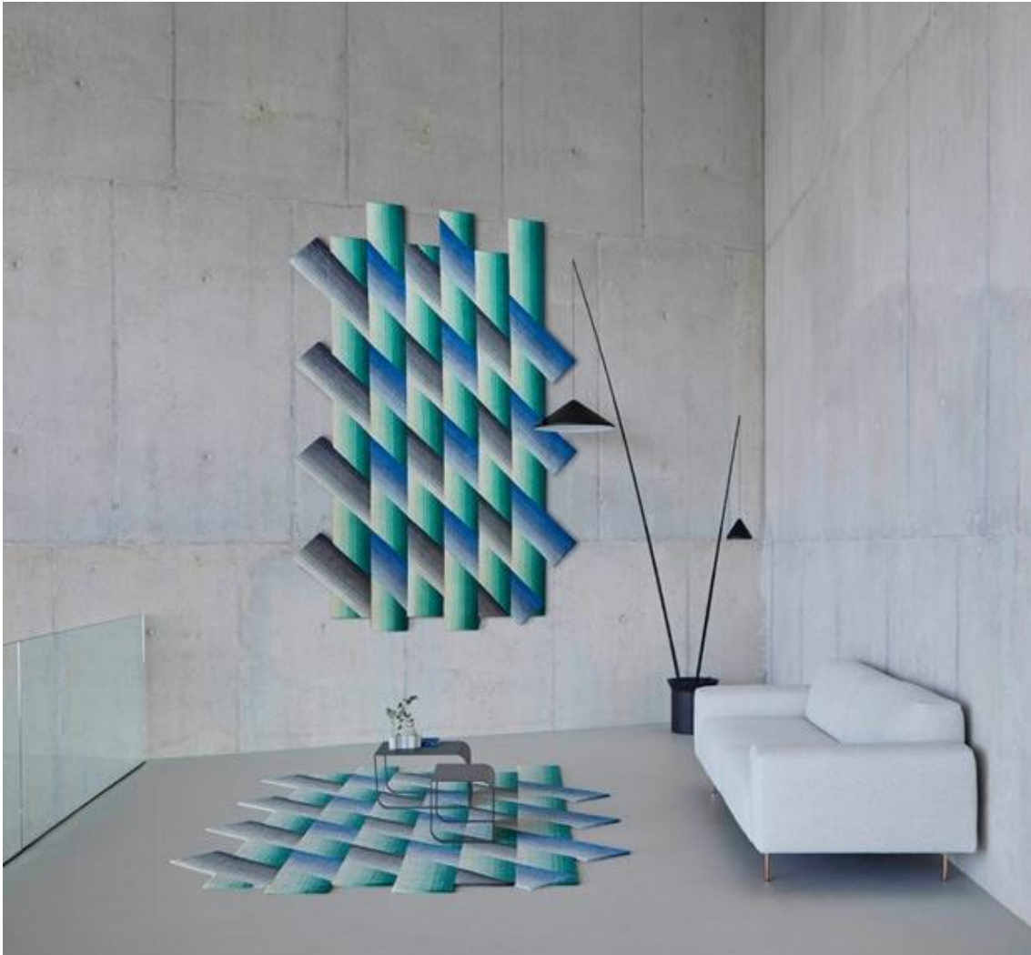
MIRAGE Teppiche. GAN

Und genau so etwas Neues ist MIRAGE , die neueste Teppich-Kollektion von GAN, signiert von der Designerin Patricia Urquiola. Hand gefertigte Teile aus Neuseeland-Wolle, die durch ihre unregelmäßige Form und Geometrie und durch ihre eigene Persönlichkeit Aufmerksamkeit auf sich zieht. Ein Stück zwischen Teppich und Kunstwerk, das sowohl den Boden sowie die Wand schmücken kann.