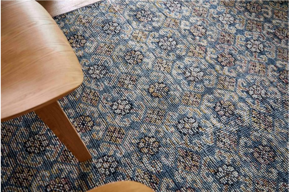
HIDRAULIC Teppich. GAN

LAN , die neue Kollektion von Neri&Hu, als Zeichen der Achtung für die asiatische Tradition - in China war indigoblau die Farbe der Einrichtungsgegenstände - mit einem revolutionärem Design, das das Sofa von Volumen befreit und ihm Leichtigkeit verleiht. Eine perfekte Kombination für zu Hause sowie für gewerbliche Bereiche, die von der NYCxDesign in der Kategorie Contract: Seating ausgezeichnet wurde. Abgesehen von neu definierten Anwendungen, werden Teppiche und Sofas von der Linie umgestaltet, in dem sie kombiniert werden, um etwas vollkommen Neues zu erschaffen.