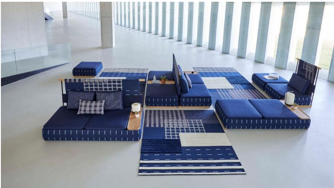
LAN Teppiche und Sitzprogramm. GAN

LAN , die neue Kollektion von Neri&Hu, als Zeichen der Achtung für die asiatische Tradition - in China war indigoblau die Farbe der Einrichtungsgegenstände - mit einem revolutionärem Design, das das Sofa von Volumen befreit und ihm Leichtigkeit verleiht. Eine perfekte Kombination für zu Hause sowie für gewerbliche Bereiche, die von der NYCxDesign in der Kategorie Contract: Seating ausgezeichnet wurde. Abgesehen von neu definierten Anwendungen, werden Teppiche und Sofas von der Linie umgestaltet, in dem sie kombiniert werden, um etwas vollkommen Neues zu erschaffen.