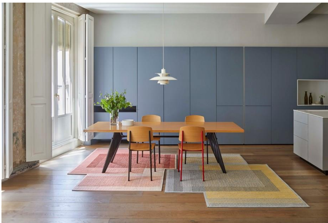
CANEVAS GEO Teppich. GAN

Dieser Blick auf vergangene Zeiten öffnet in der Kollektion CANEVAS GEO von Charlotte Lancelot für GAN neue Horizonte. In diesem Fall mit Kreuzstichen aus farbigen Wollfäden auf perforiertem Filz, was Farbraster und Overlay-Effekte erzeugt. Eine Kombination die mit passenden Kissen abgerundet wird.