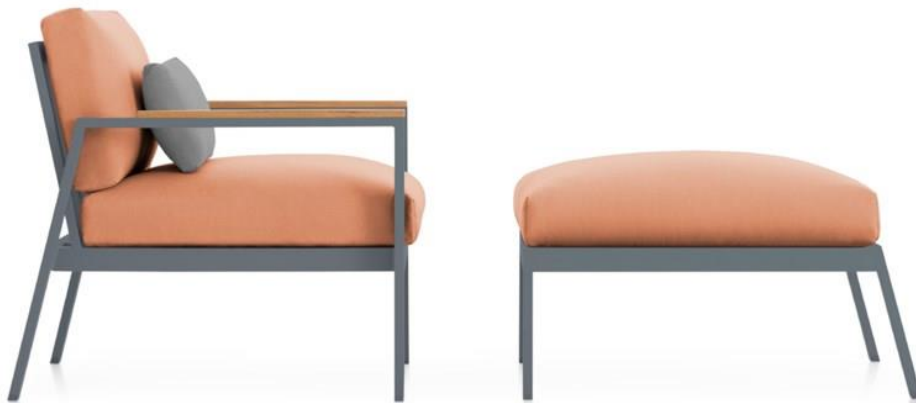
TIMELESS Armstuhl für Aussenbereich. GANDIABLASCO

Diesem innovativem Ansatz schließt sich gleichzeitig die Ehrlichkeit der zeitlosen Gestaltung von TIMELESS , ein Design von José A. Gandía-Blasco Canales und Borja García, an, das in die rationale Architektur des 20. Jahrhunderts eintaucht, um zugleich diskrete und eindrucksvolle Formen zu schaffen.