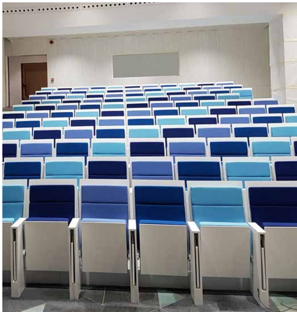
CASA DEL CORAZÓN DE MADRID MADRID (ESPAÑA) MOD. MUGOR