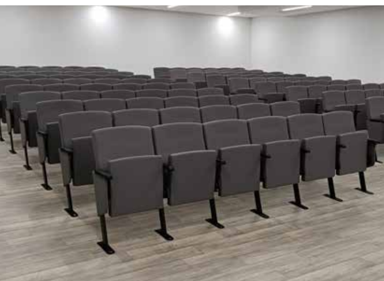
COLEGIO RICHMOND PARK SCHOOL MADRID MADRID (ESPAÑA) MOD. ENERGY