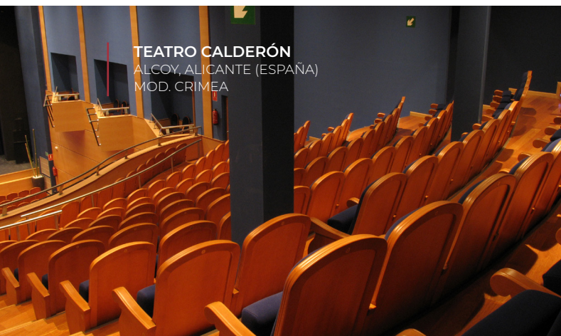
TEATRO CALDERÓN ALCOY, ALICANTE (ESPAÑA) MOD. CRIMEA