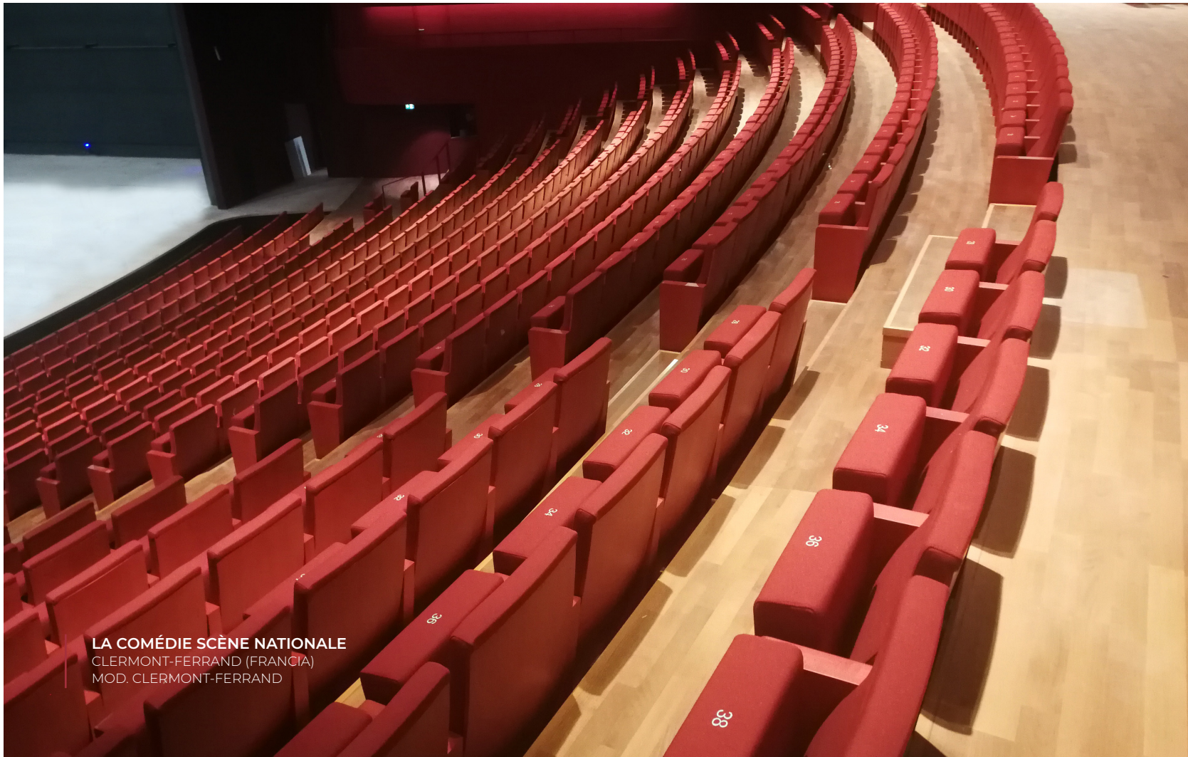
LA COMÉDIE SCÈNE NATIONALE CLERMONT-FERRAND (FRANCIA) MOD. CLERMONT-FERRAND