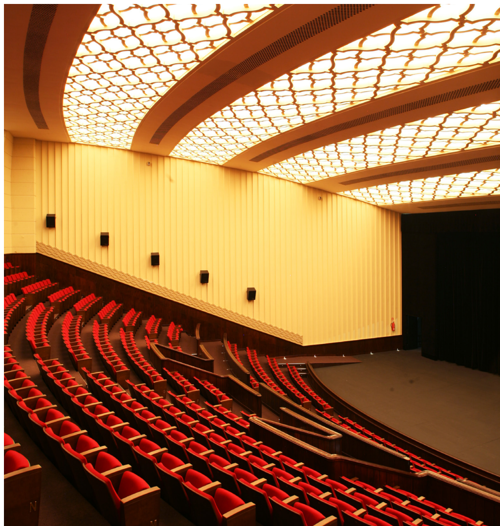
CINEMA SÃO JORGE LISBOA (PORTUGAL) MOD. BÁLTICO