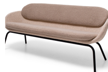
Sofá Cross 170