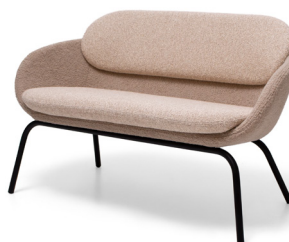
Sofá Cross 120