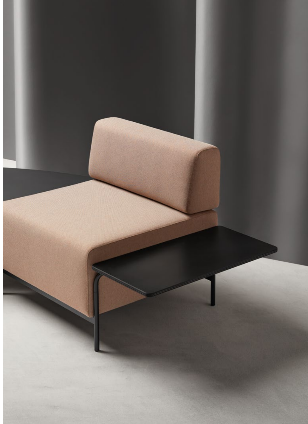
MODULAR CONNECTION CONEXIÓN MODULAR