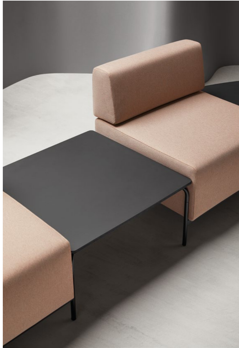
> Seats CB1P, upholstery JUST JU63094 and structures colour RAL 9005. Tables CMAC, CMCC, CMCE and CMEL, top compacmel black and structure colour RAL 9005.