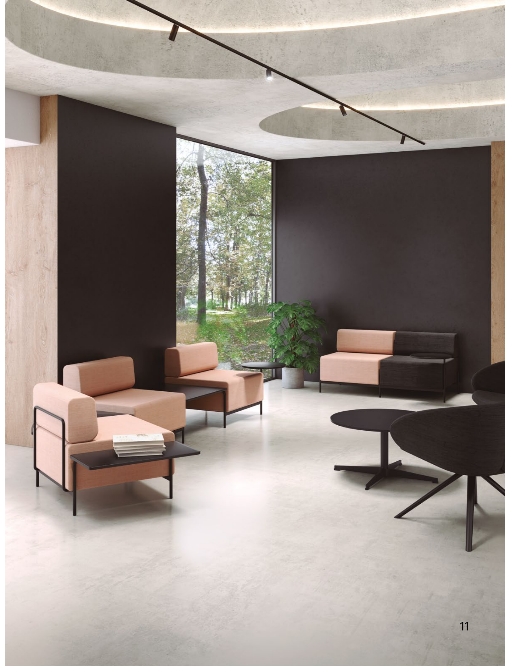
> Seat CB1P, upholstery ERA CSE14 and structure colour RAL 9005. Armchairs PEACH PEBG upholstery ERA CSE14 and structure colour RAL 9005. Table WIDE WIAS42 & WITL 600mm, colour RAL 9005.