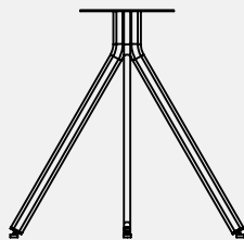
ODCE73 W 748 X 748 mm H 730 mm 7,7 kg

ODLA73 (2 unidades): Conjunto de pies laterales de 2 patas metálicas de tubo oval de 40x20mm y altura 730 mm.