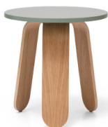
Mesa auxiliar Heilan 01