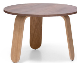
Mesa auxiliar Heilan 02 70Ø