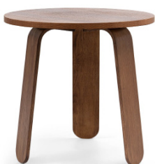
Mesa Heilan 80Ø