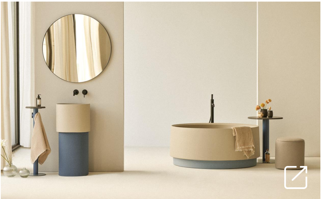
Colección de Baño OASIS por Jorge Herrera | SANYCCES