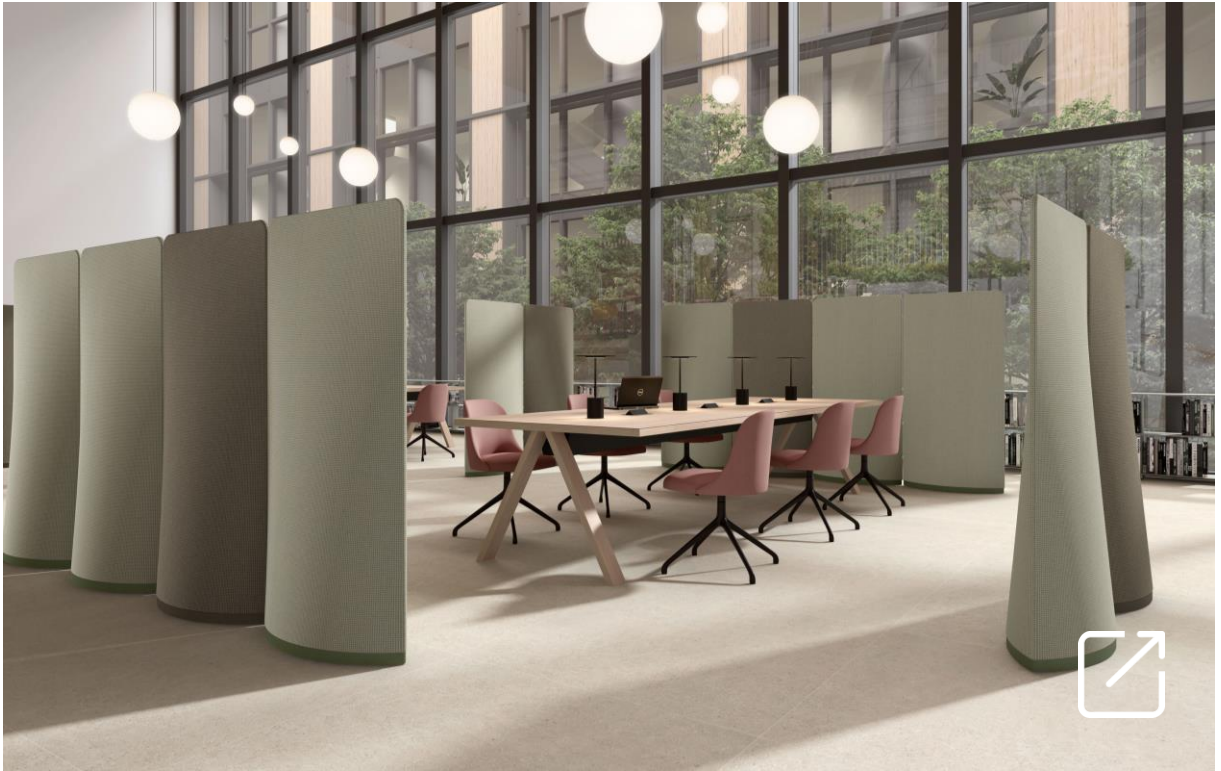
Separadores Acústicos SAIL por Aitor García de Vicuña | SYSTEMTRONIC