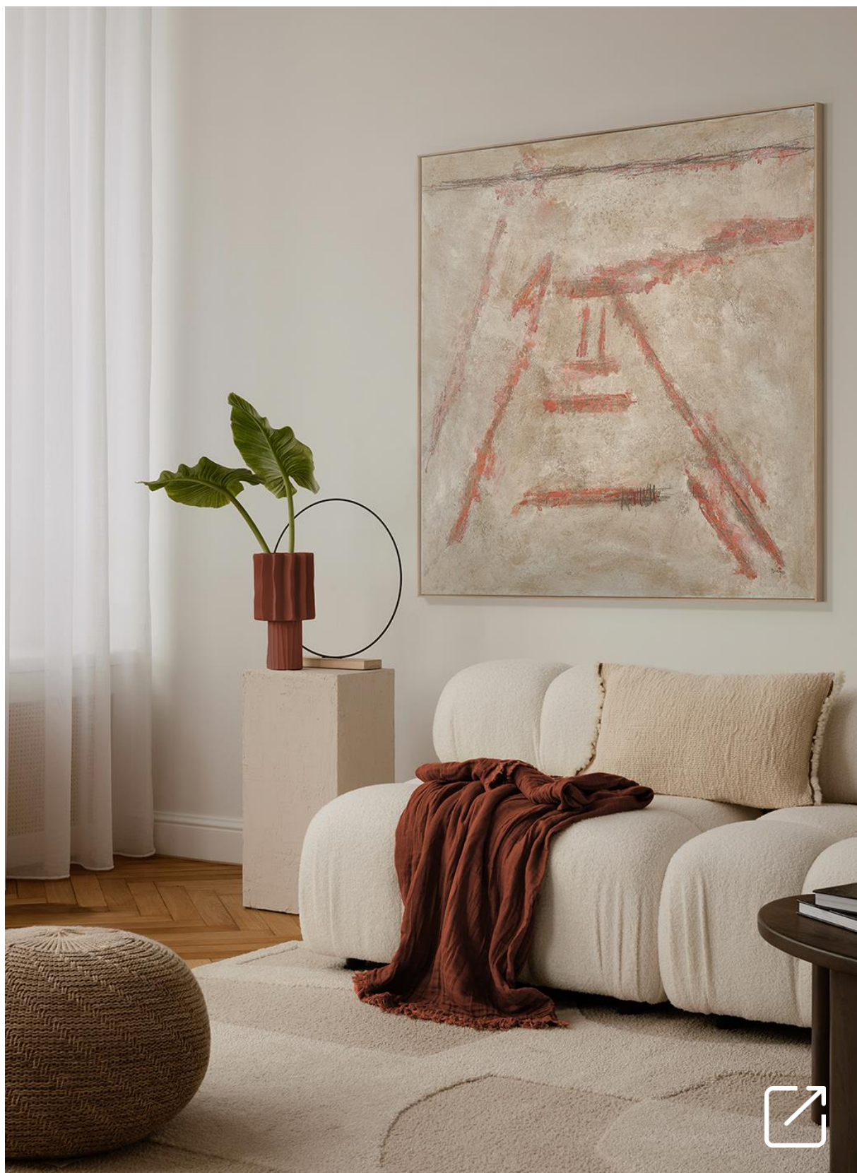
Pintura Mixta sobre Lienzo ARENA 05 por Diego Serra | PERSPECTIVA 10