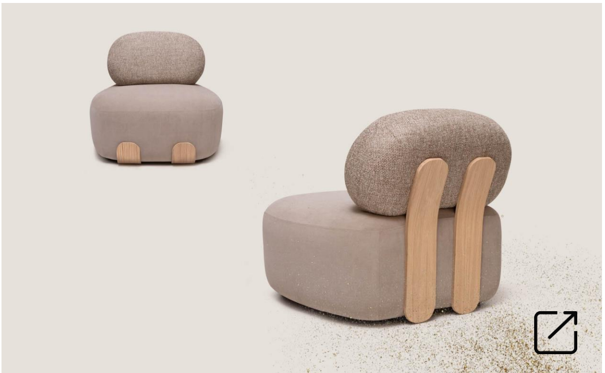
Silla Lounge HEILAN SUPER | CASUAL Home & Contract