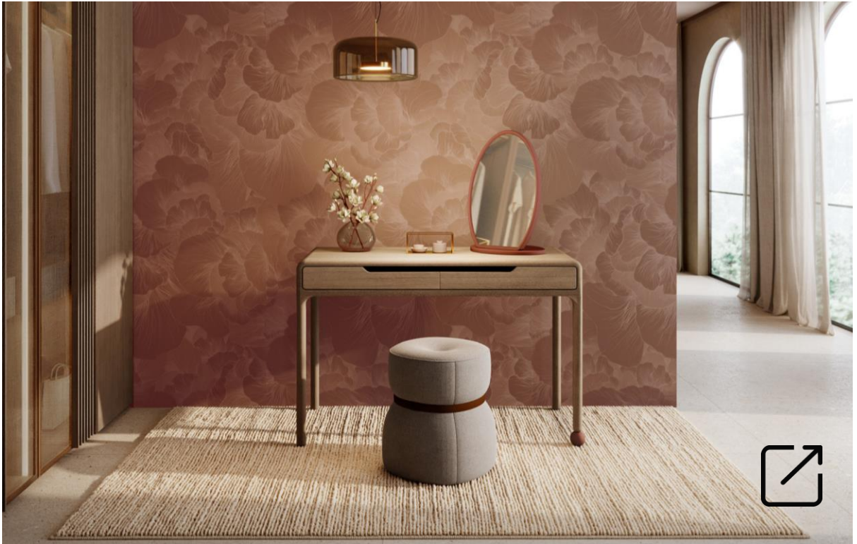
Tocador CANICA por Teresa Sapey | UECKO