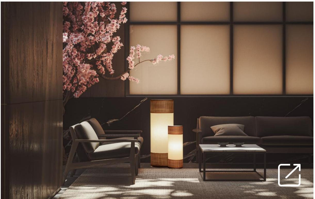
Lámparas TAMIZ L & M por Andrés Martínez | NOMON