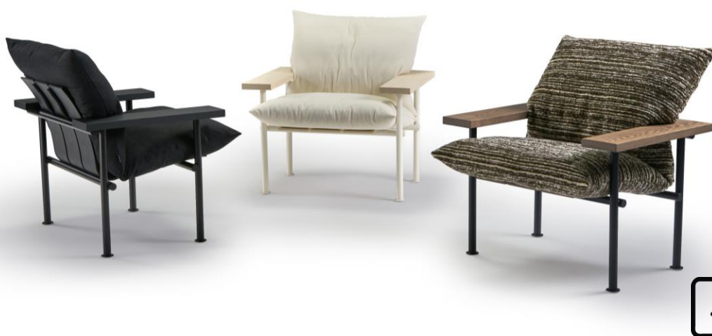
Silla Lounge PALMA por Marc Morro | SANCAL