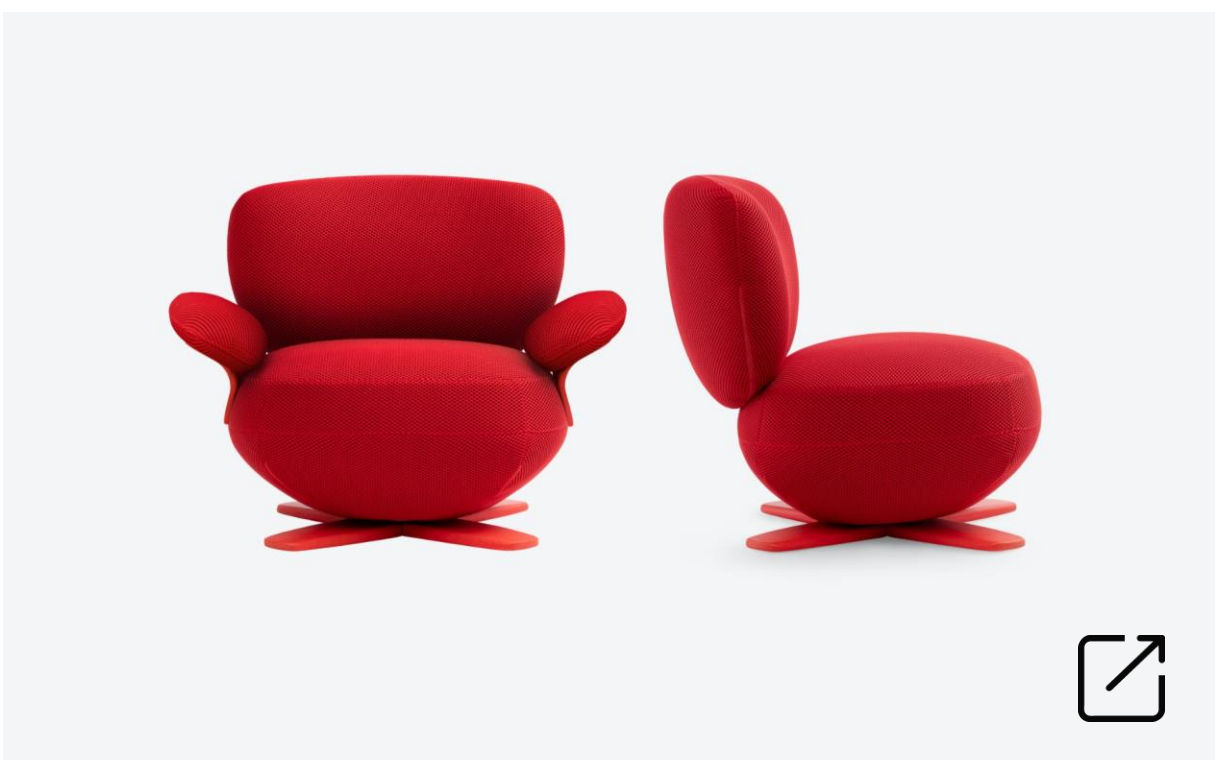
Silla Lounge RABBIT B por Carlos Soriano | TM Leader Contract