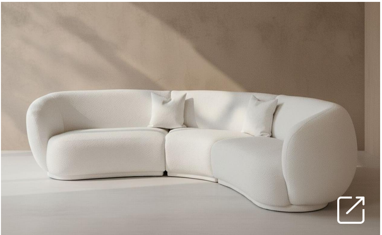
Sofá COLMAR | ORMO'S