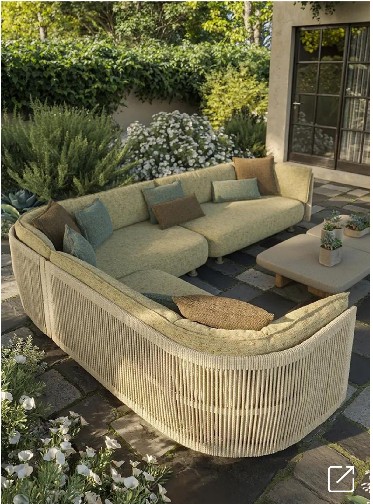
Colección de Exterior SERRA por Jean-Marie Massaud | VONDOM