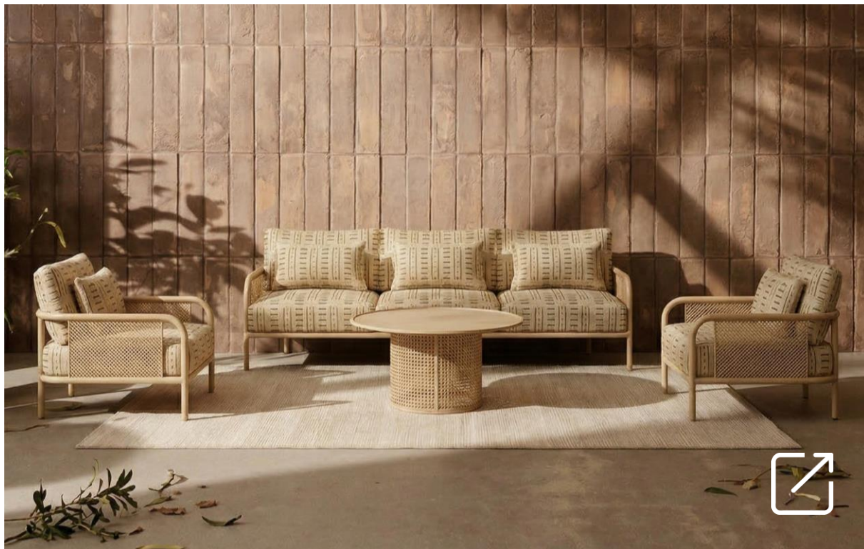
Colección de Exterior MAGNA por ILMIODESIGN | iSiMAR