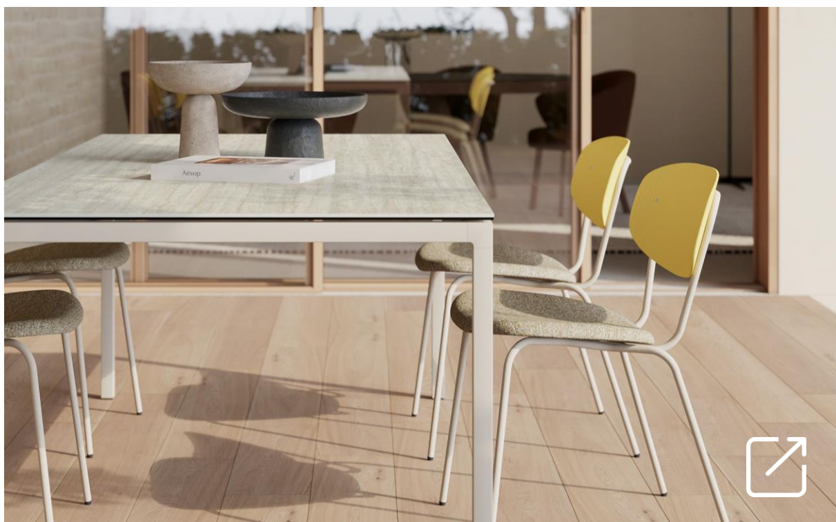
Silla VAIREA por YONOH Studio | MUSOLA