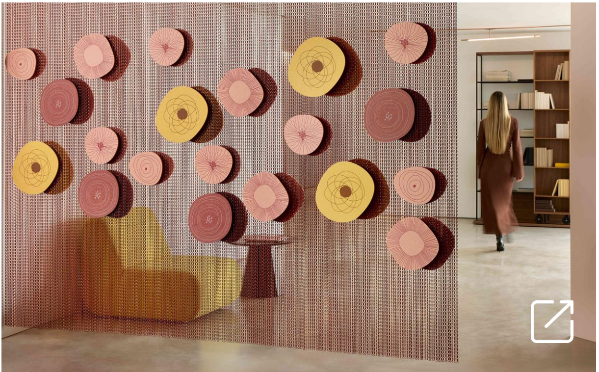
Cortinas Metálicas KRONOS por Rafa Ortega | KRISKADECOR