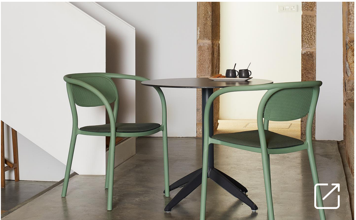
Silla NOON PAD por Héctor Serrano | EZPELETA