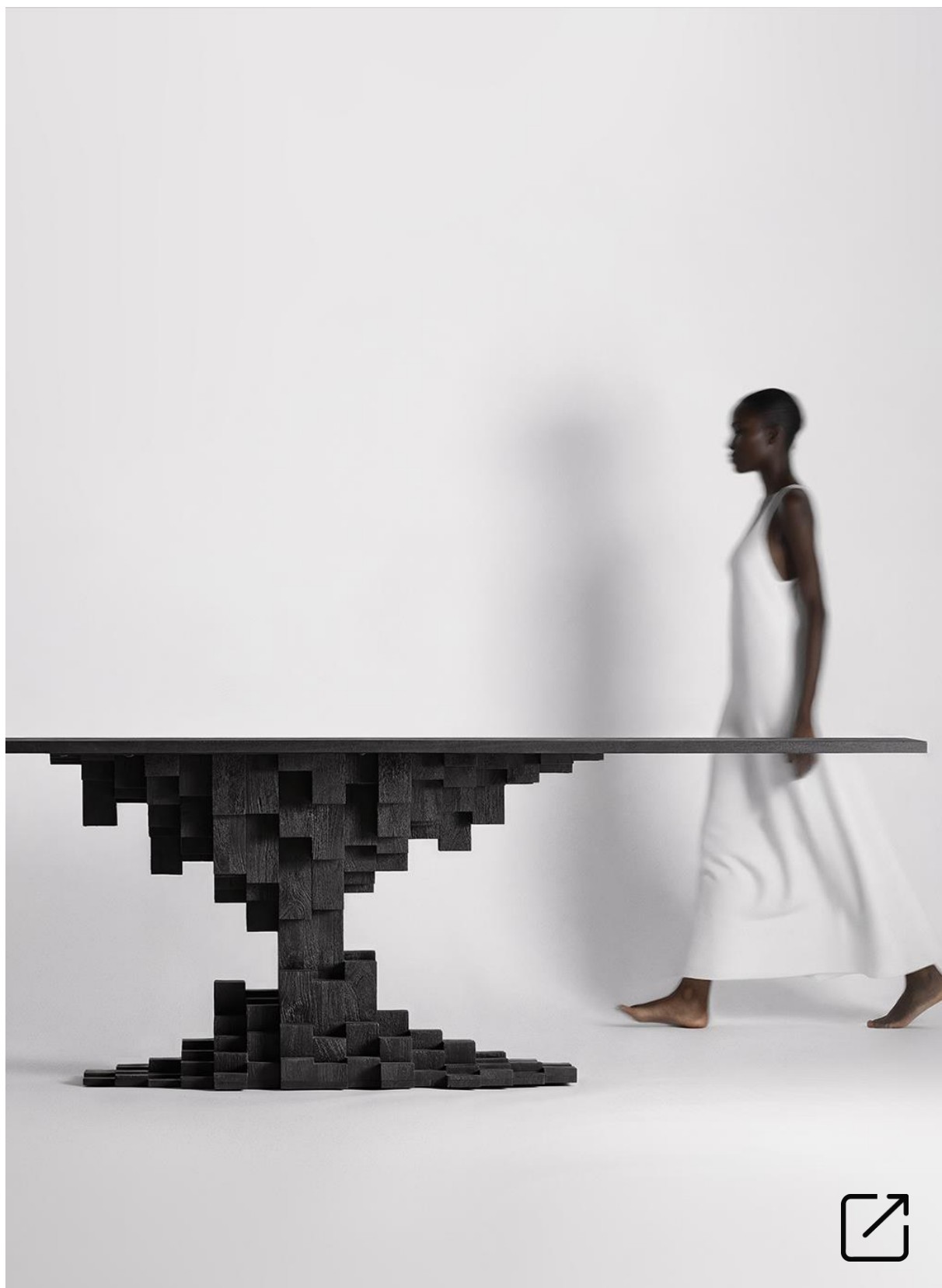
Mesa PETRIA por Pep Gramage | VICALDesign