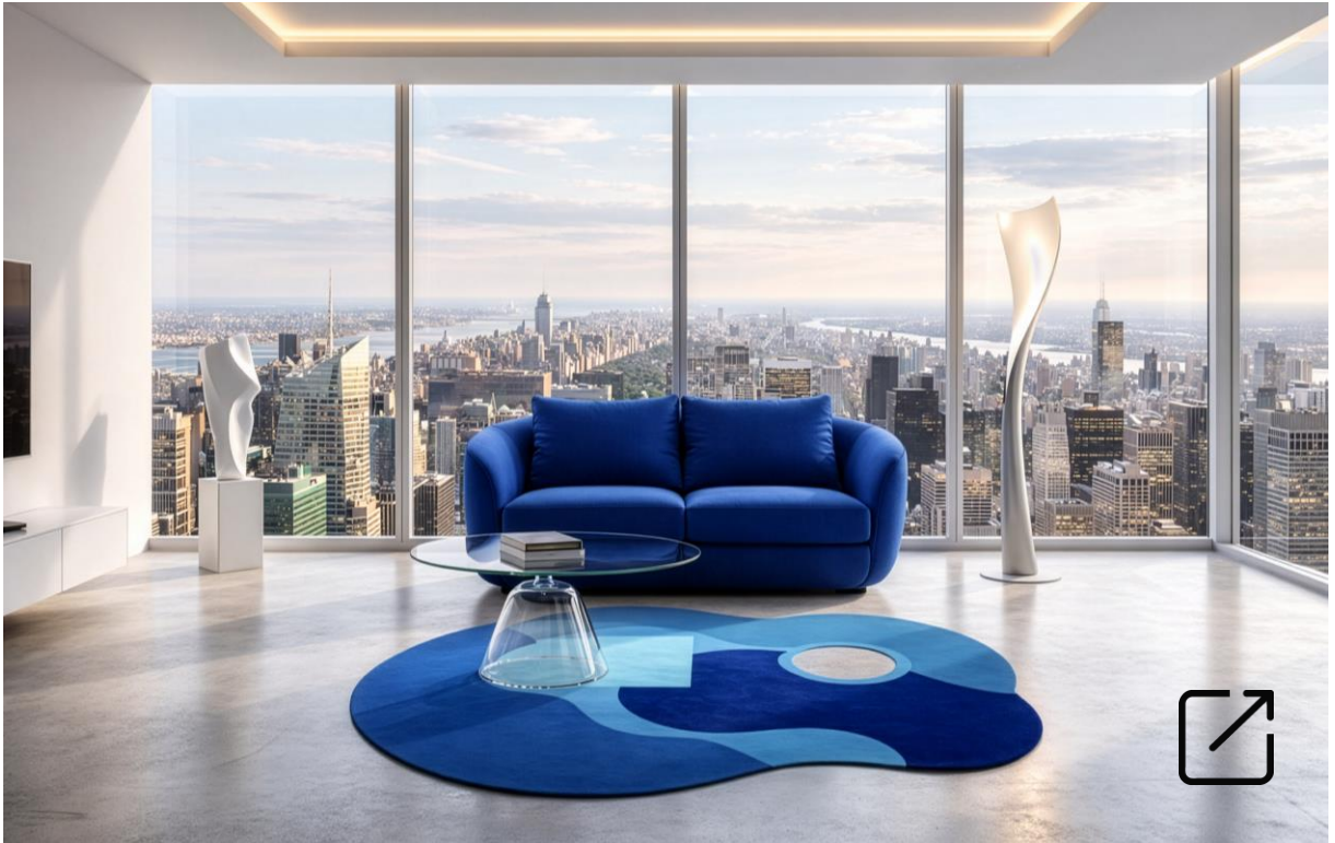
Sofá HUG por Karim Rashid | NISI Family