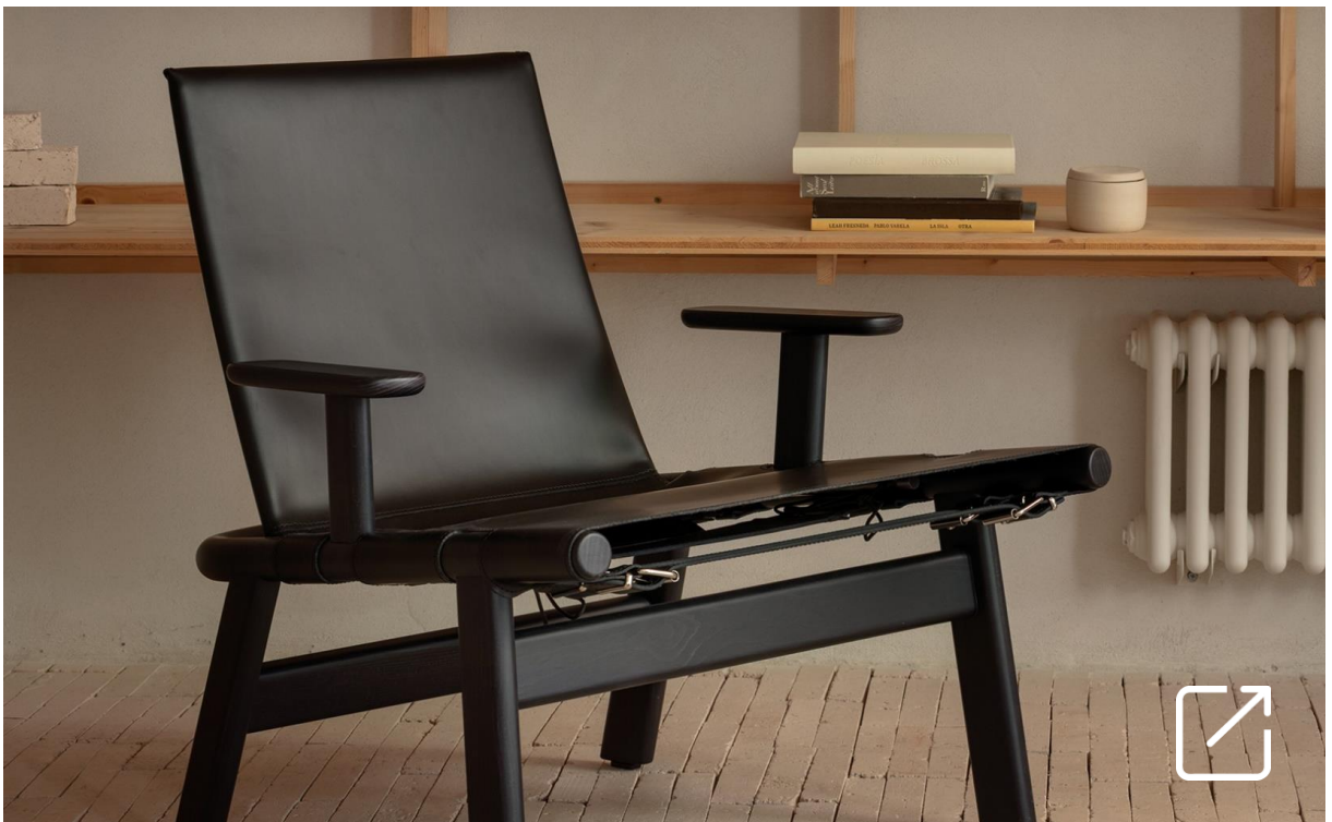
Sillón TREK por Anderssen&Voll Studio | VERGÉS