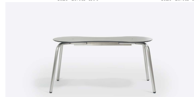
TAM INOX BANCO DOBLE