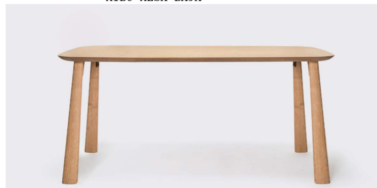
MIBU MESA H75