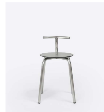
TAM INOX H45

Para el accesorio cojín, recomendamos tapicerías de exterior de nuestra colección