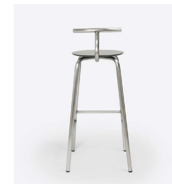
TAM INOX H75