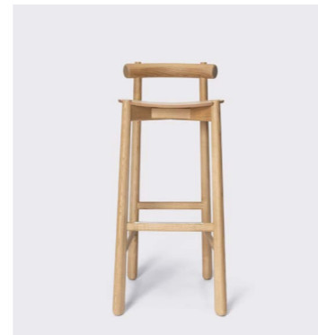
MIBU TABURETE H75