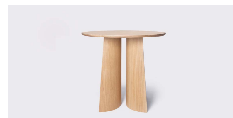
GIN MESA H75