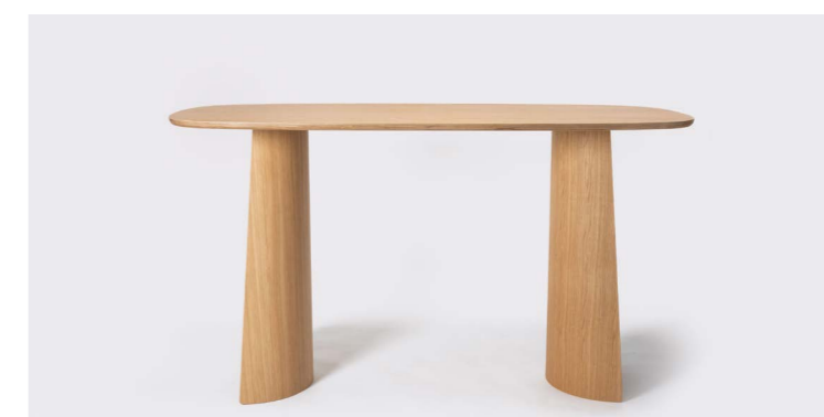
GIN MESA H110