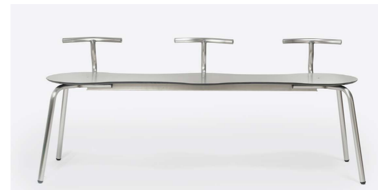
TAM INOX BANCO TRIPLE