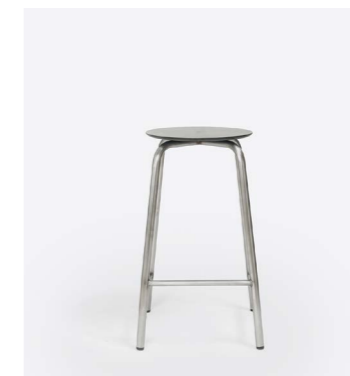
TAM INOX H65