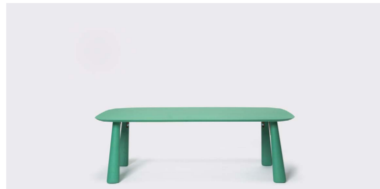
MIBU MESA BAJA