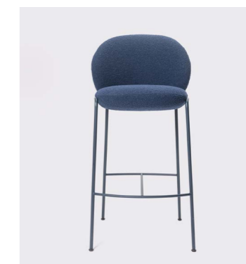
GIN TABURETE H75